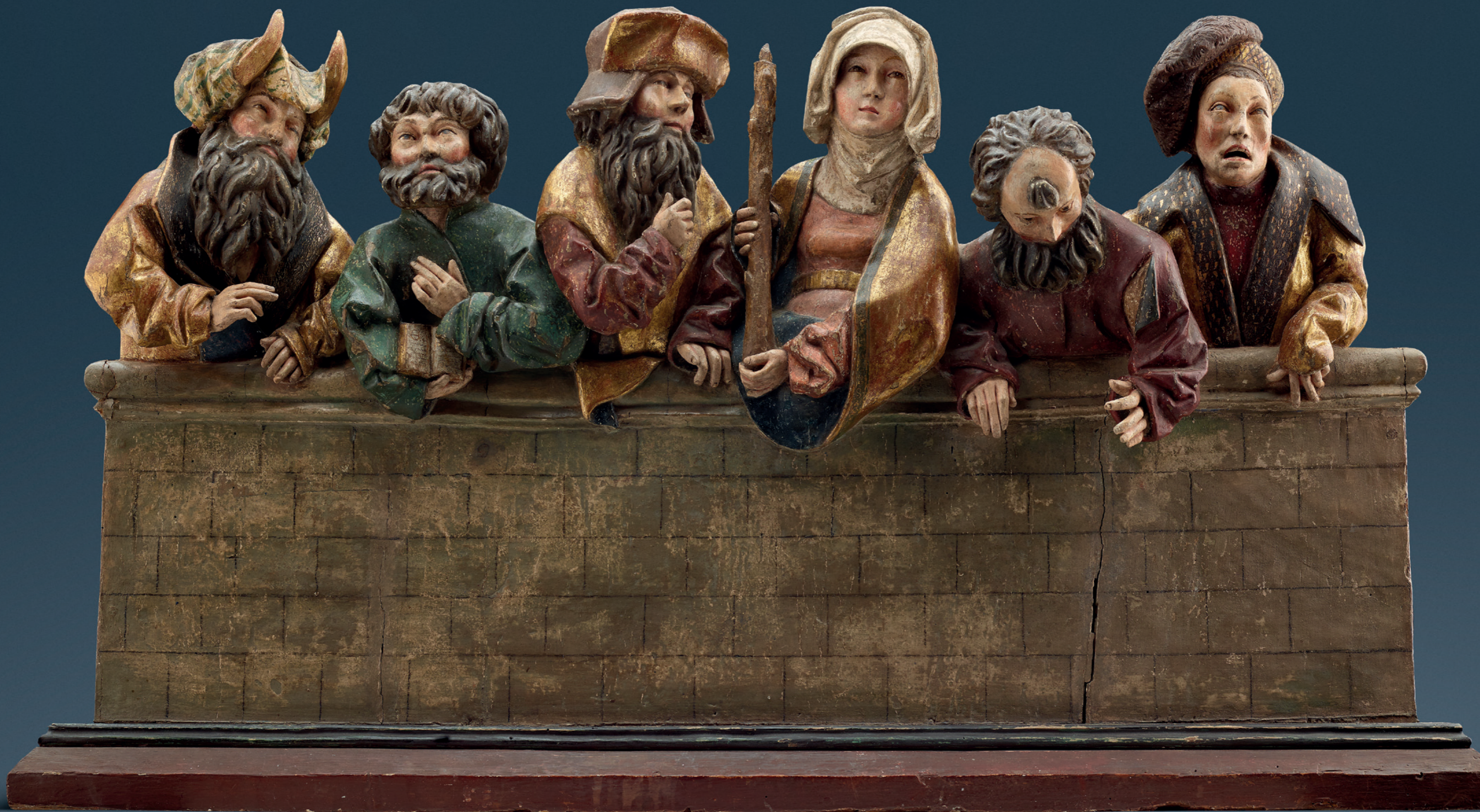
„Eine Gruppe von Heiligenfiguren“ von links nach rechts: Moses, Petrus, Joachim mit Anna, Paulus und Jesaja oder Bartholomäus Tirol, um 1520 Lindenholz geschnitzt, rückseitig geflacht, alte Fassung und Fassungsreste aus der Barockzeit Höhe: 56 cm, Breite: 100 cm