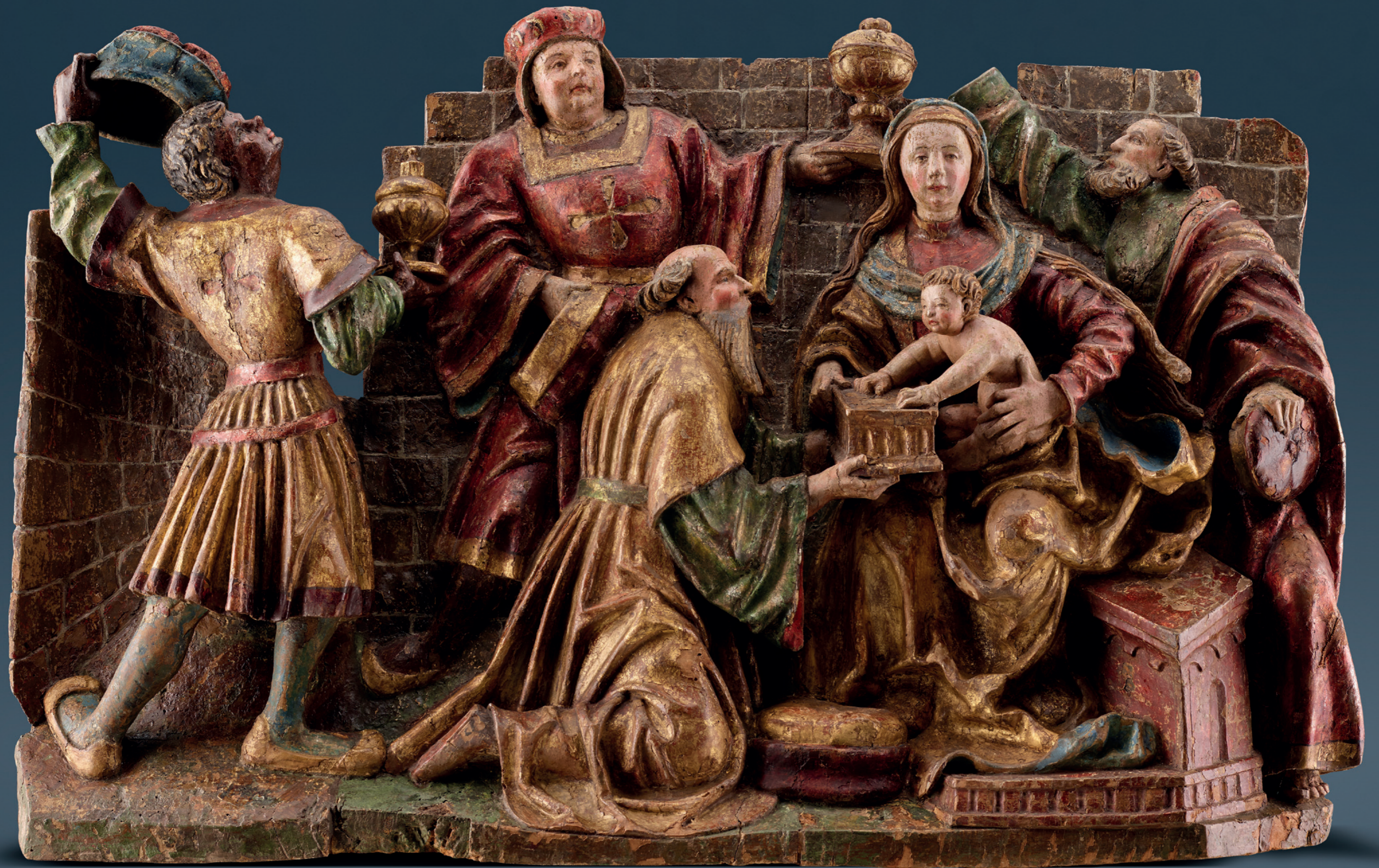
„Anbetung der Heiligen Drei Könige“ Donauschule, um 1520 Relief, Lindenholz geschnitzt, mit Resten der originalen Fassung Höhe: 55 cm, Breite: 84 cm