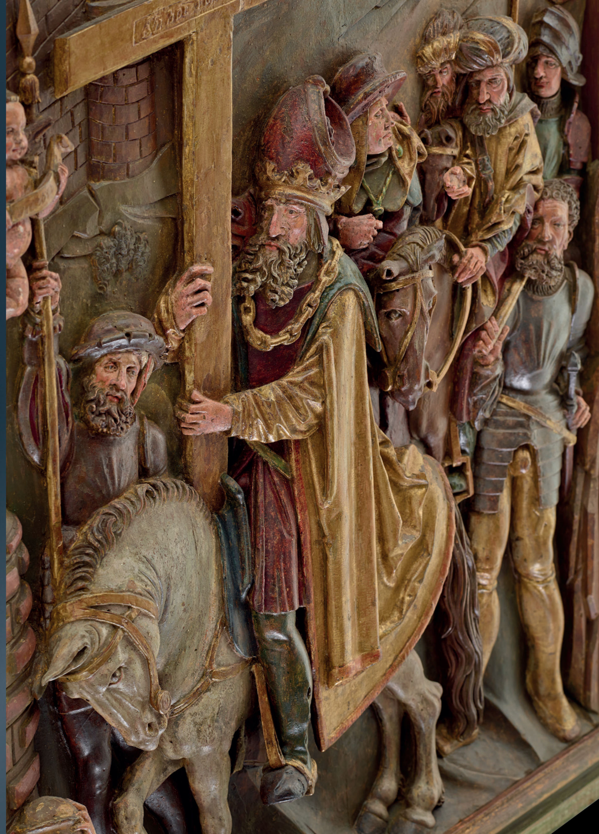
„The Emperor Heraclius returns the True Cross to Jerusalem“ South German, circa 1520 Relief, linden wood, original polychrome Height: 86 cm, width: 70 cm