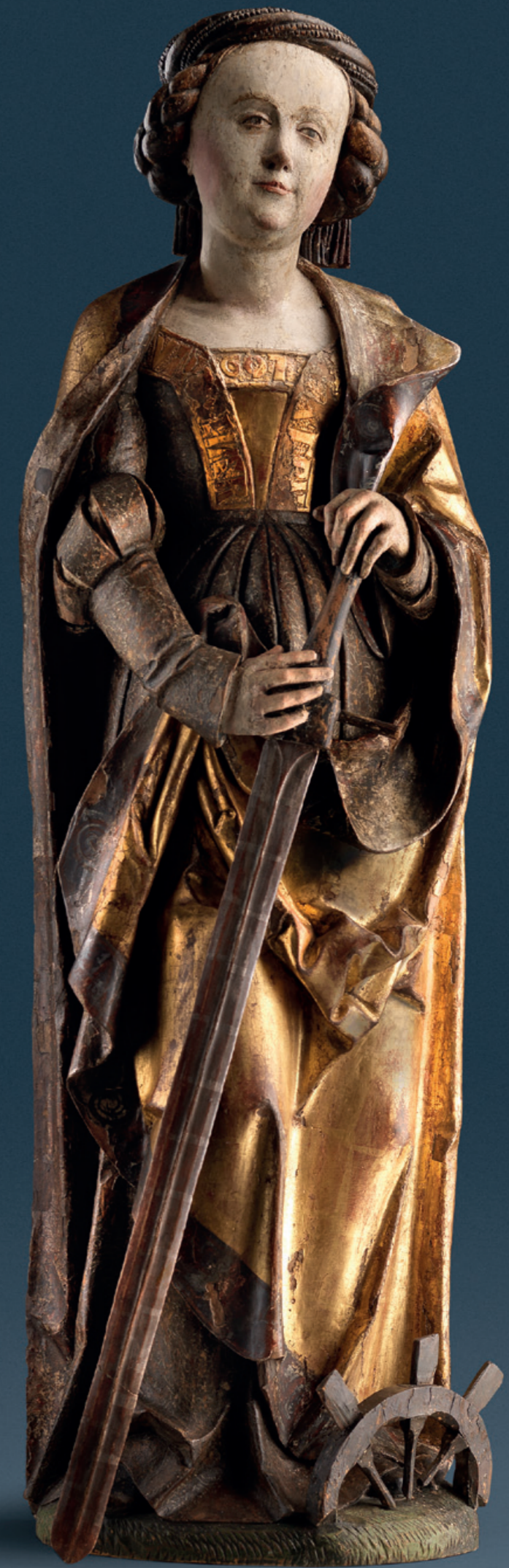
Saint Catherine Circle of master Daniel Mauch (circa 1477 Ulm - 1540 Lüttich) Ulm, circa 1500 Linden wood, fully carved, original polychrome Height: 114 cm Literature: Allgemeines Künstlerlexikon, H. Vollmer, Leipzig, 1930, Vol 24, pp. 270-271