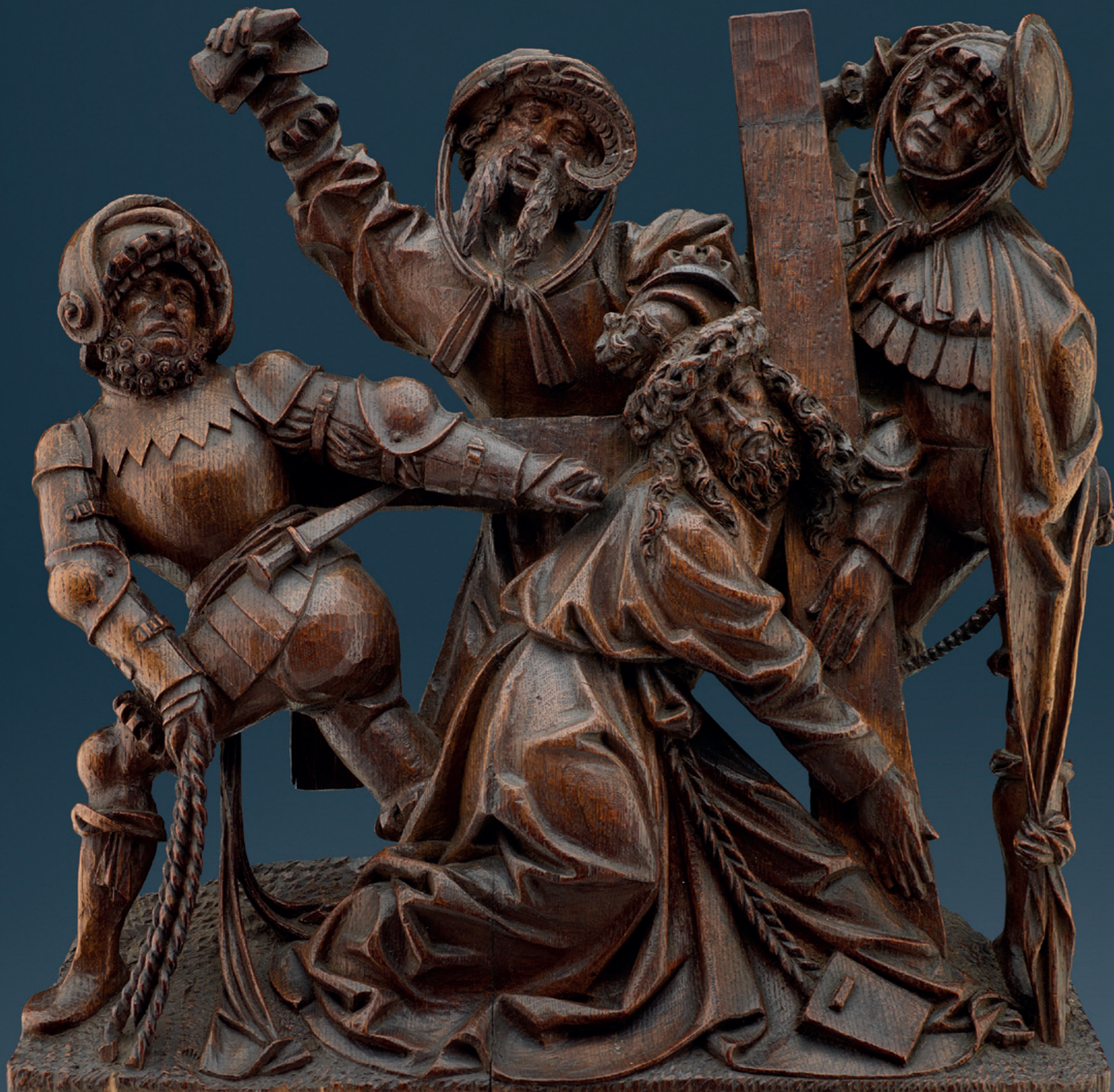
Kalvarienbergszene Brabant, Antwerpen, um 1515 Eichenholz geschnitzt, ursprünglich Teil eines Retabels Höhe: 50 cm, Breite: 52 cm, Tiefe: 10 cm Literatur: Beeldhouwkunst van de Zuidelijke Nederlanden en het Prinsbisdom Luik, A. Huysmans (Hrsg.), 1999, vergleiche mit S. 188, Nr. 99