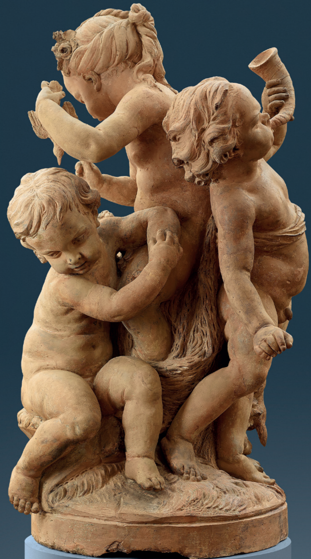
A pair of terracotta groups „Putti playing with goat and dog“ Edme Bouchardon (1698 Chaumont en Bassigny - 1762 Paris) France, circa 1740 Height: 122 cm Literature and provenance: Catalogue des Objets D'Art, Galerie Georges Petit, Paris, 1899, illustration No 126 Private collection Thomas Fortune Ryan, New York, 1933, illustration No. 299