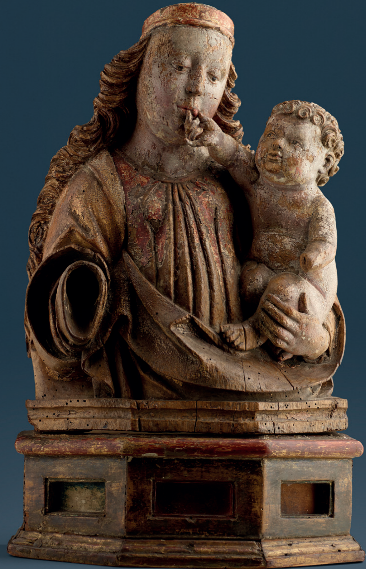
Maria mit Kind Oberrhein, um 1500 Halbfigur, Lindenholz geschnitzt, rückseitig gehöhlt, mit Resten der originalen Fassung Höhe: 37 cm, Höhe (mit Sockel): 52 cm Rückseitig Inventarnummer: 1493 MA, 86o KVI. des Bayerischen Nationalmuseums, München. Literatur: Kataloge des Bay. Nationalmuseums, Das Mittelalter, II. Gotische Alterthümer der Baukunst und Bildnerei, Dr. Hugo Graf (Hrsg.), Bd. 6, München 1896, S. 54, Nr. 86o