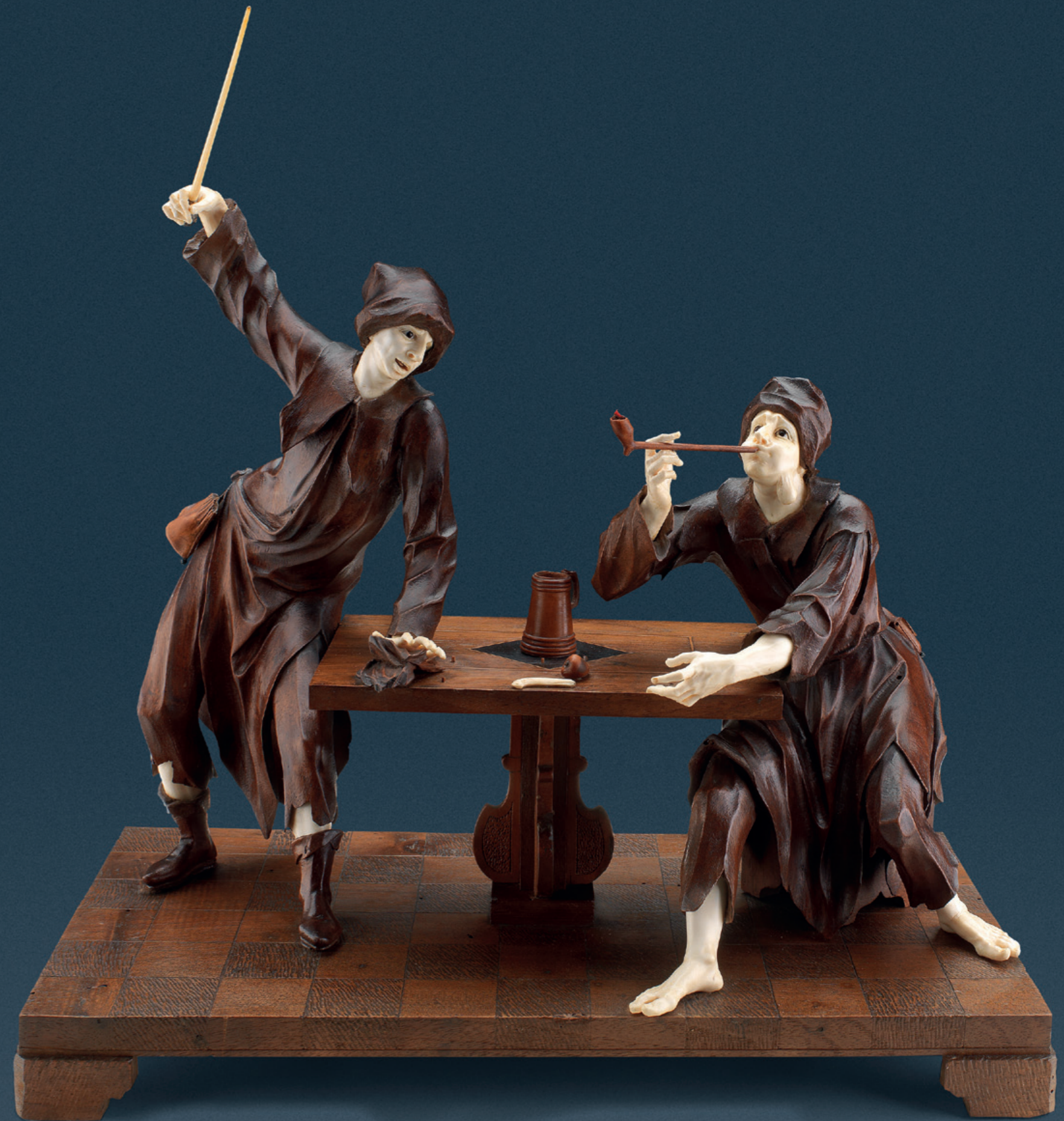
Umkreis Meister Simon Troger (1693 Abfaltersbach, Osttirol - 1768 München, Haidhausen) „Zwei von drei Figurengruppen“ Bayern, Mitte des 18. Jahrhunderts Nussbaumholz geschnitzt, Elfenbein Höhe: 33 cm, Breite: 34,5 - 36,5 cm, Tiefe: 15-19 cm

Literatur: „Elfenbein - Kunstwerke des Barock“ Ausstellungskatalog des Staatlichen Museums Schwerin, K. von Berswordt-Wallrabe (Hrsg.), Schwerin 2000, S. 120-125, vergleiche Abbildungen Nr. 67, 68 und 69