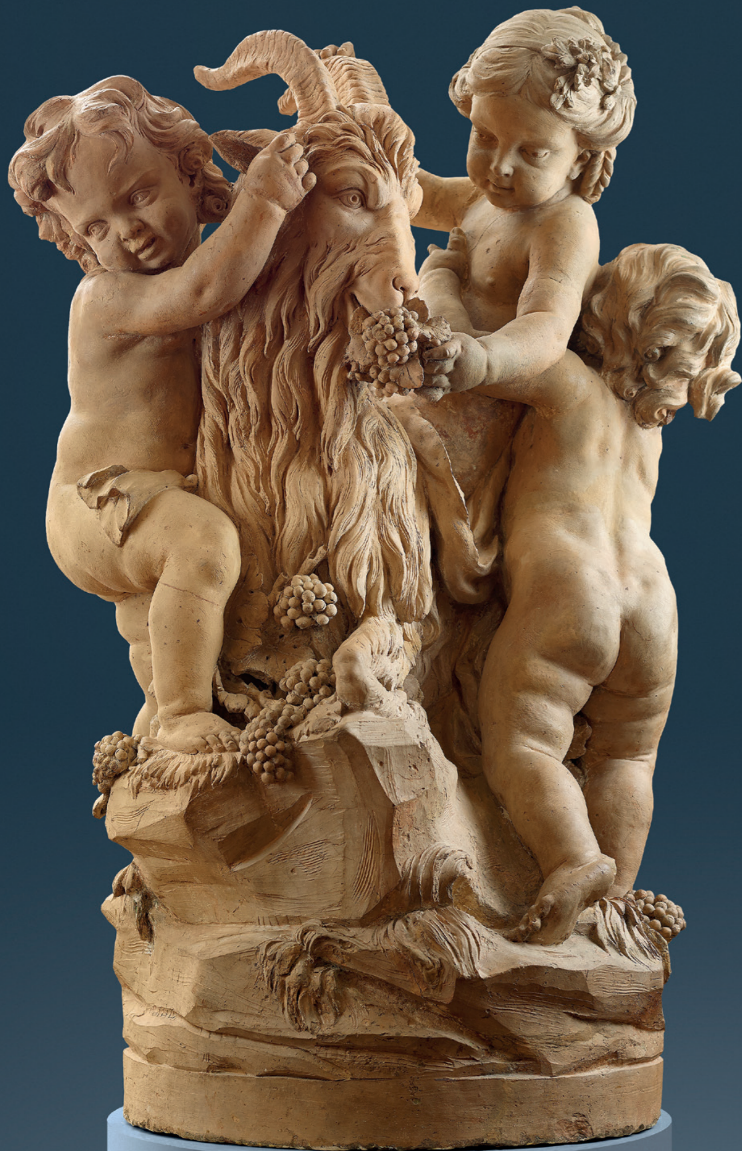
Ein Paar Figurengruppen „Spielende Putti mit Ziegenbock und Hund“ Edme Bouchardon (1698 Chaumont en Bassigny - 1762 Paris) Frankreich, um 1740 Höhe: 122 cm Literatur und Provenienz: Catalogue des Objets D'Art, Galerie Georges Petit, Paris, 1899, Abbildung Nr. 126 Privatsammlung Thomas Fortune Ryan, New York, 1933, Abbildung Nr. 299