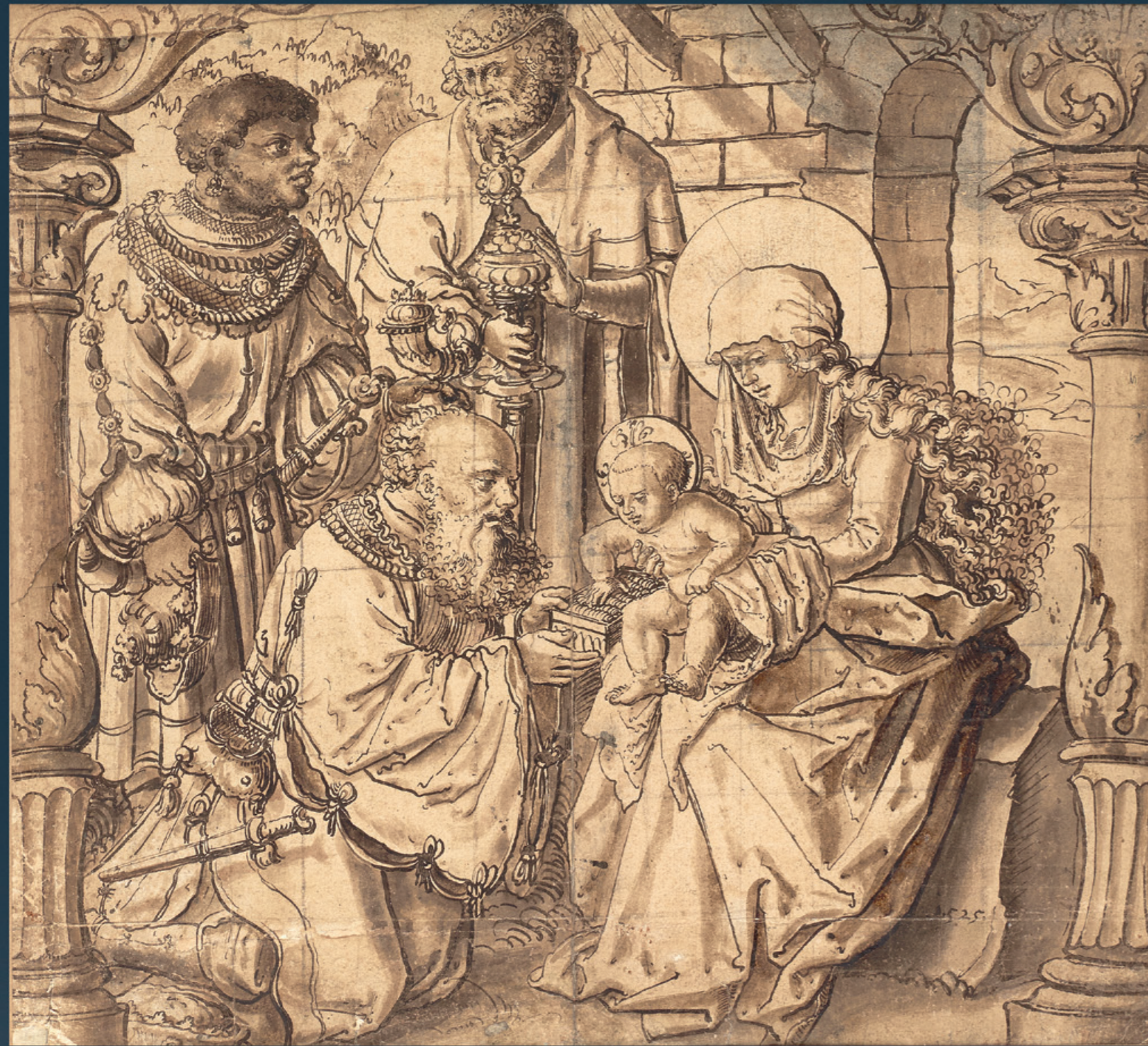
„Anbetung der Könige“ Nürnberg/Donauschule Datiert unten rechts „1525“ Tuschzeichnung auf Papier Höhe: 33,5 cm, Breite: 37,3 cm