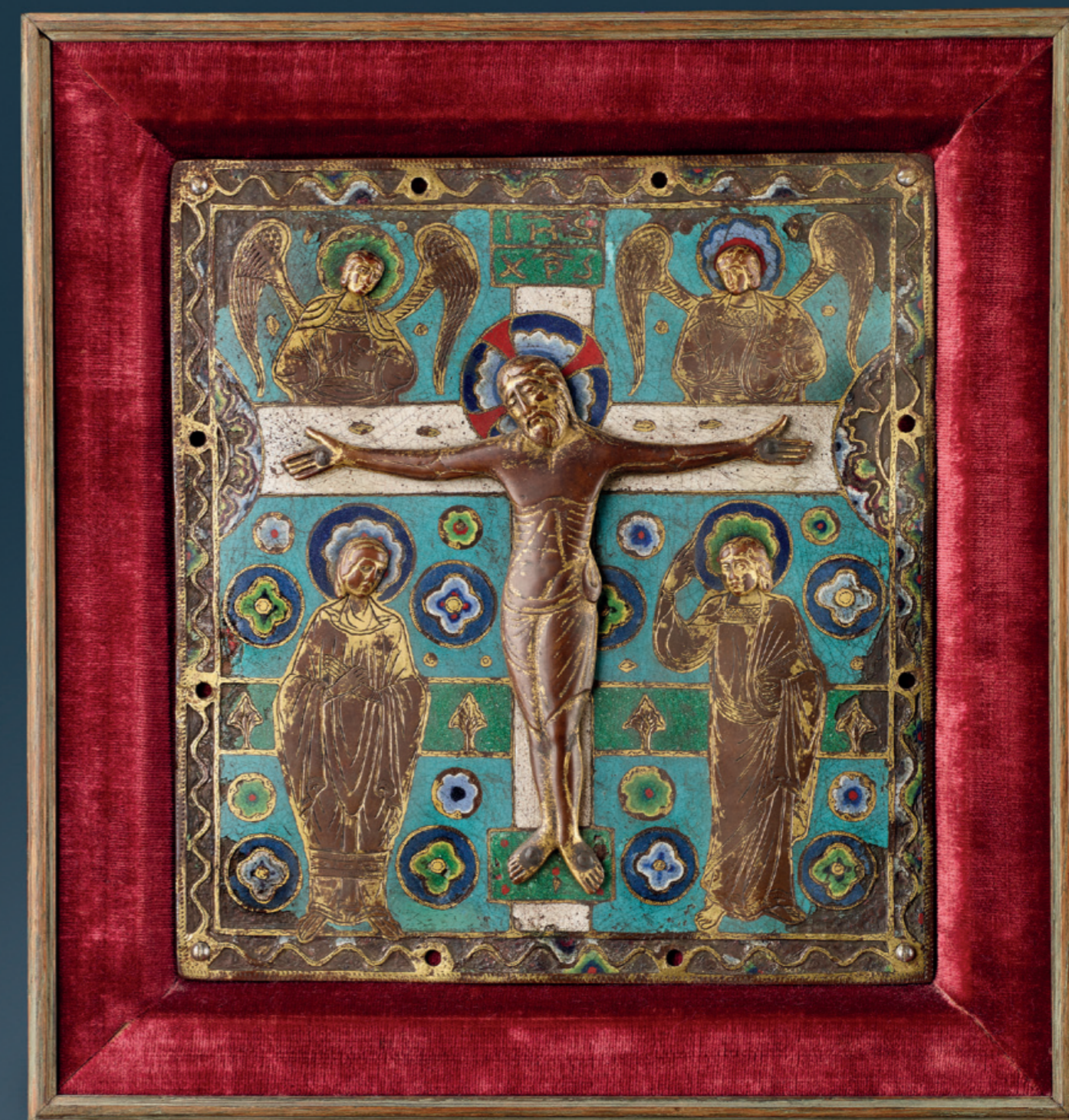
„Kreuzigungsszene mit Engeln“ ursprünglich Vorderseite eines Buches oder Altarschreins Limoges, um 1200 Kupfer, originale Teilvergoldung, emailliert Höhe: 18 cm, Breite: 16,5 cm Literatur: Enamels of Limoges 1100-1350, The Metropolitan Museum of Art (Hrsg.), Paris u.a., Musée du Louvre/ The Metropolitan Museum of Art 1995/96, New York 1996, S. 250/251, S. 330/331