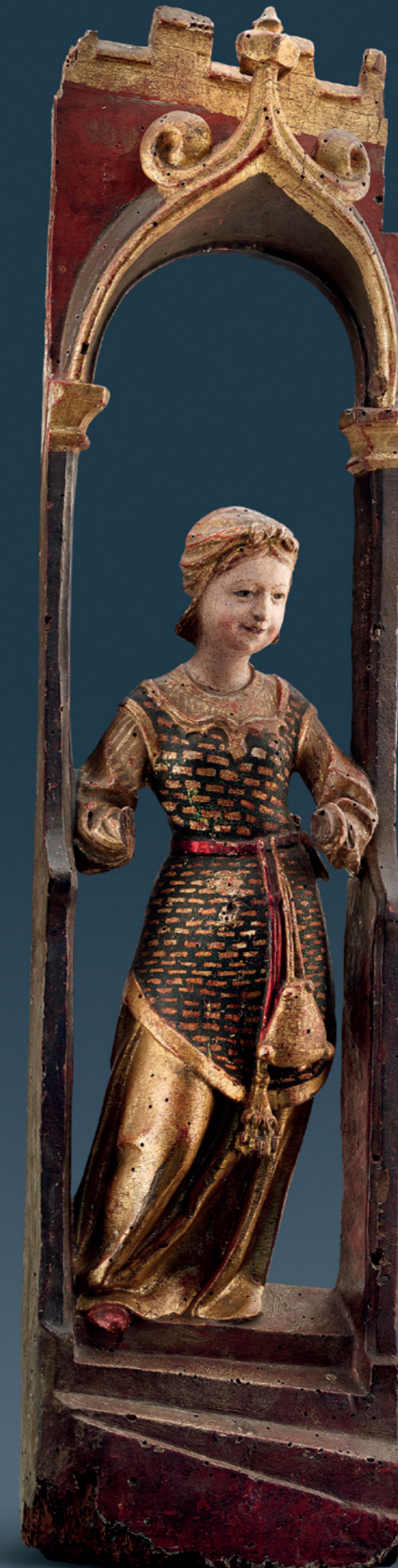
Weibliche Heilige Italien, um 1500 Ursprünglich Teil eines Retabels Lindenholz geschnitzt, rückseitig geflacht, originale Fassung Höhe: 85 cm