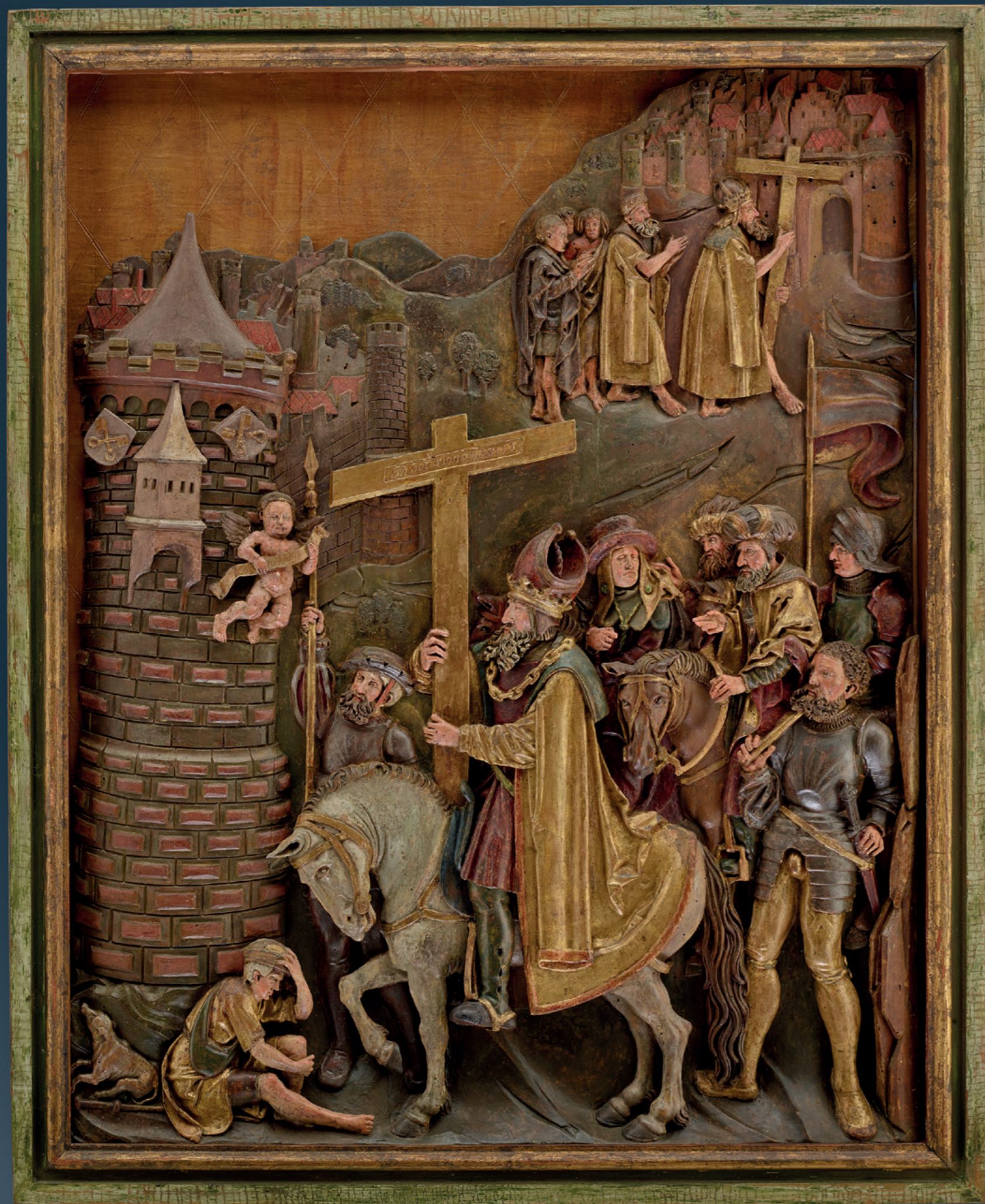
„Kaiser Heraklius bringt das Kreuz Christi nach Jerusalem zurück“ Süddeutsch, um 1520 Relief, Lindenholz geschnitzt, originale Fassung Höhe: 86 cm, Breite: 70 cm