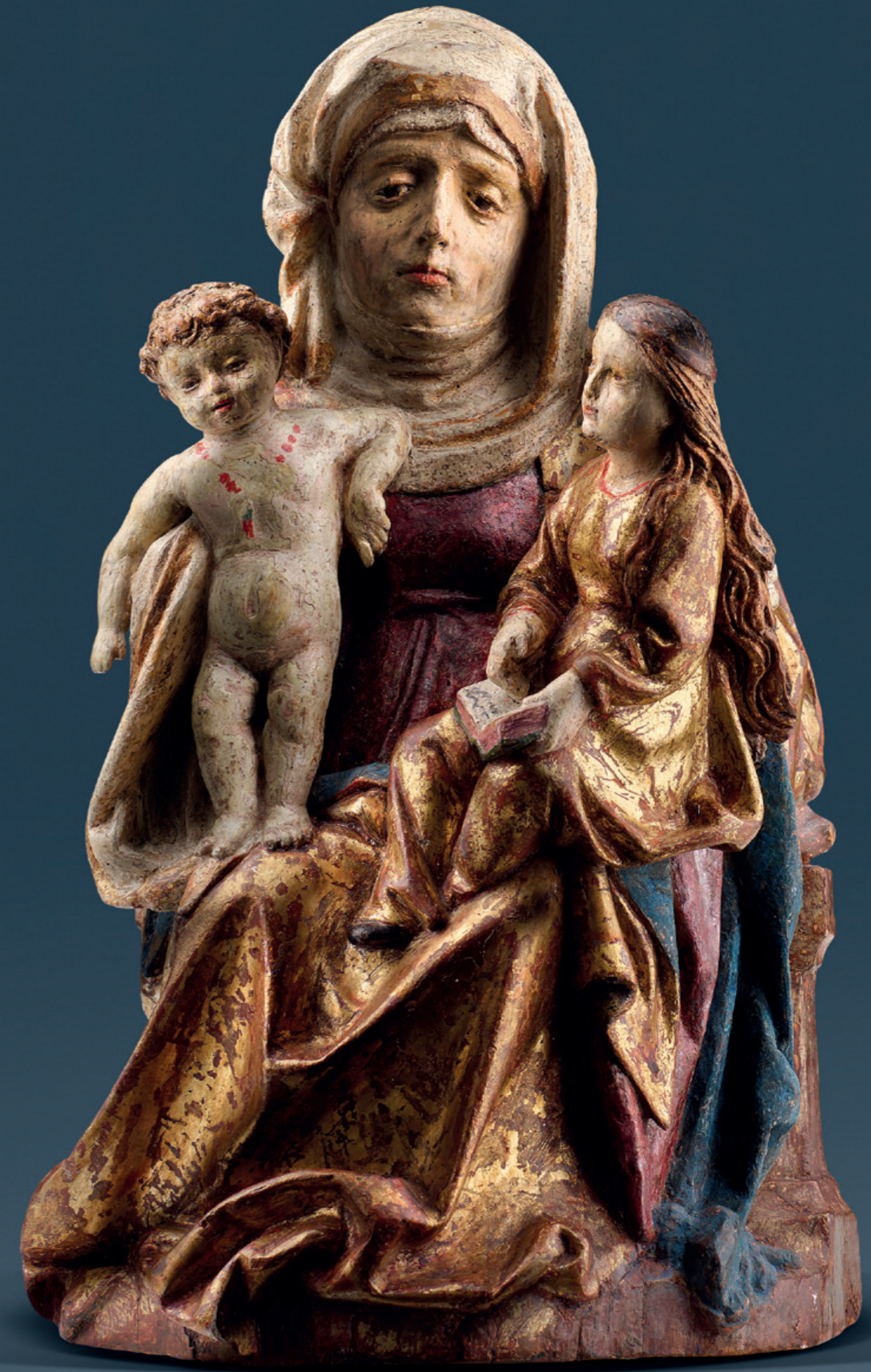
Anna Selbdritt Schwaben, um 1510/20 Meister der Biberacher Sippe, Zuschreibung Lindenholz, vollrund geschnitzt, alte Fassung Höhe: 24,5 cm Literatur: C. Lichte, H. Meurer (Hrsg.) Die mittelalterlichen Skulpturen. Landesmuseum Württemberg. Stuttgart 2007, vergleiche S.154/155, Nr. 120