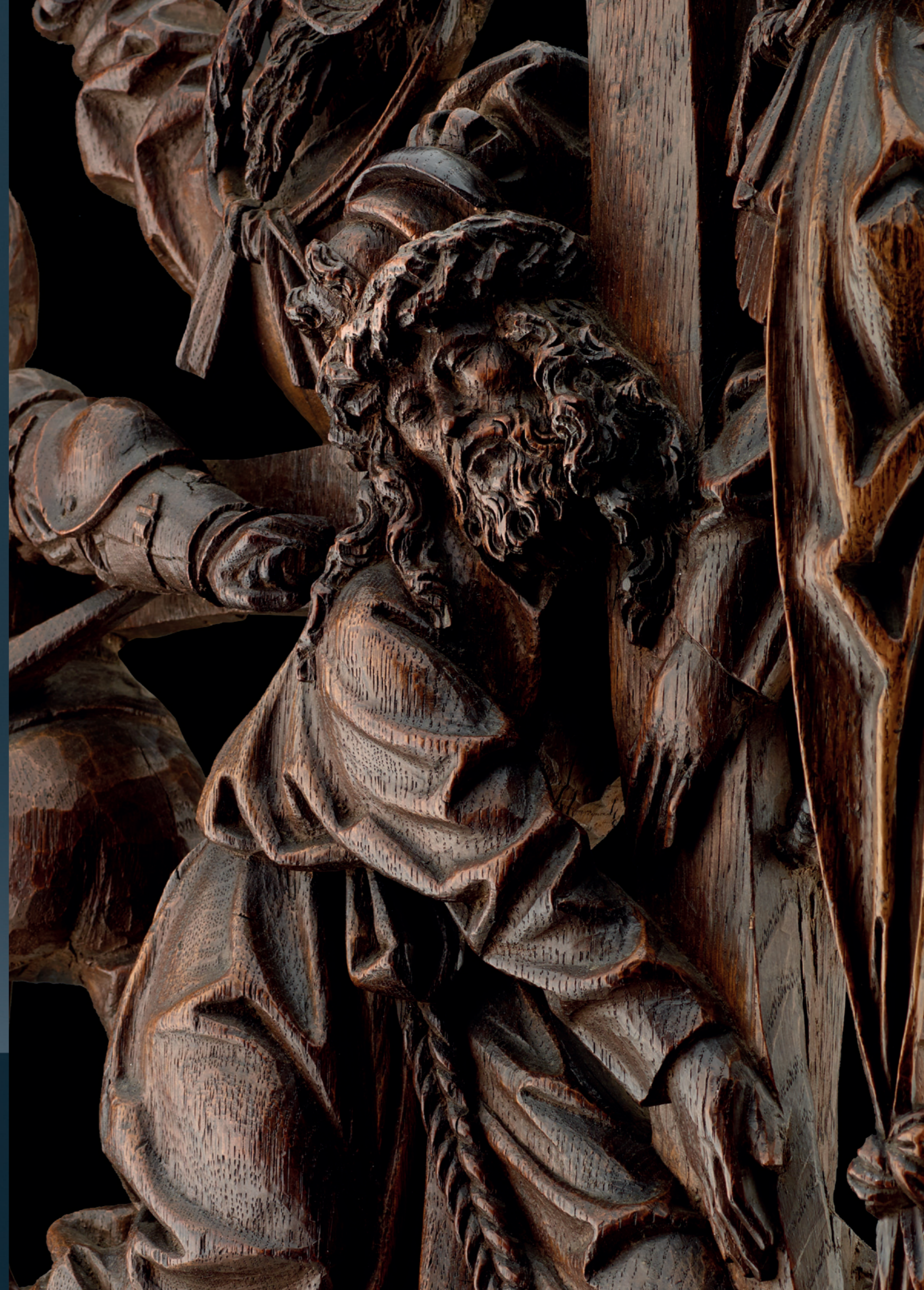
Depiction of Calvary Brabant, Antwerp, circa 1515 Oak wood carved, originally part of a retabel Height: 50 cm, width: 52 cm, depth: 10 cm Literature: Beeldhouwkunst van de Zuidelijke Nederlanden en het Prinsbisdom Luik, A. Huysmans (ed.), 1999, compare with page 188, No. 99